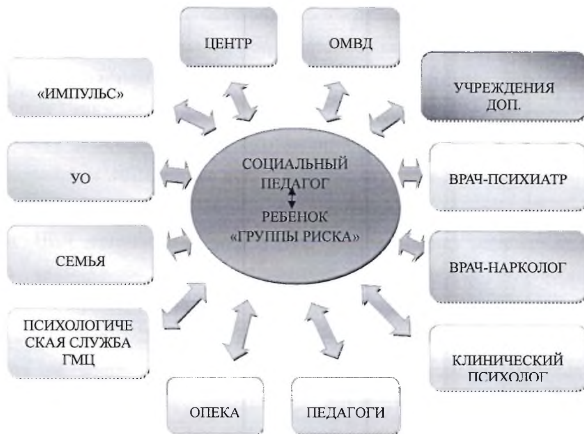
СХЕМА взаимодействия в процессе реализации программы

Заключение. В ходе реализации данной программы важным моментом сопровождения обучающегося группы риска является опора на внутренний потенциал развития ребенка, на право обучающегося самостоятельно совершать выбор и нести за него ответственность. Следовательно, для осуществления права свободного выбора, различных альтернатив развития необходимо научить обучающегося выбирать, помочь ему разобраться в сути проблемной ситуации, выработать план решения и сделать первые шаги. Также необходимо сформировать и закрепить у обучающихся знания о соблюдении законодательства Российской Федерации, понятия о здоровом образе жизни и негативных последствиях вредных привычек, соответственно создаются условия достижения требований образовательного стандарта.